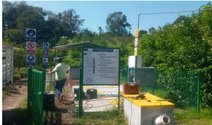
Figura 5. PTAR localizada en vivero “La Cúspide”.

Eliminación de bacterias y partículas coliformes.