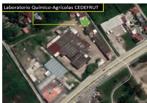
Figura 2. Ubicación geográfica de Laboratorio Químico-Agrícolas CEDEFRUT.

Ser el mejor centro de integración, formación, información, desarrollo y modernización tecnológica de la cadena productiva de cítricos y otros frutales de trópico húmedo, reconocido a nivel nacional e internacional por su alta calidad en los servicios y compromiso social que vincule las necesidades trascendentes y reales de incremento de competitividad de sus asociados y clientes