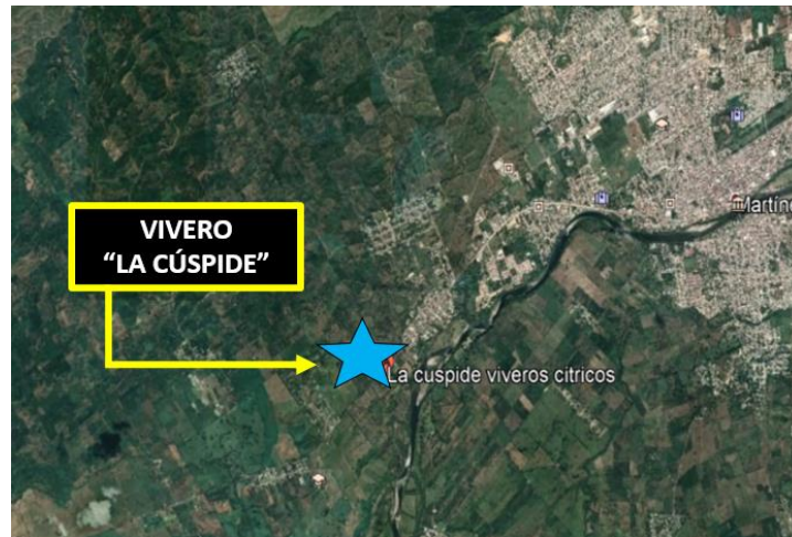
Figura 3. Ubicación geográfica de Vivero “La Cúspide”, Tlapacoyan, Veracruz.

. (SISTEMA DE INFORMACIÓN MUNICIPAL, 2019)