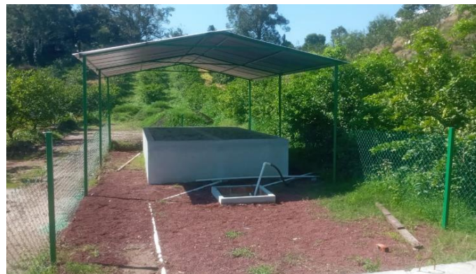
Figura 6. Lecho de secado de la PTAR.