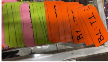
Figura 11. Etiquetas para los tratamientos.