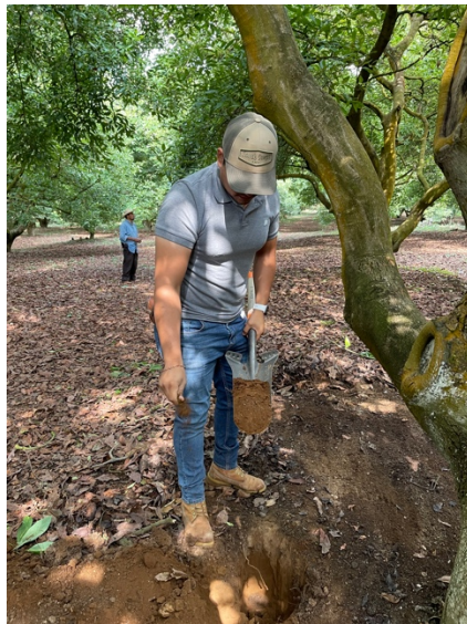
Figura 9. Muestra de perfil de suelo.