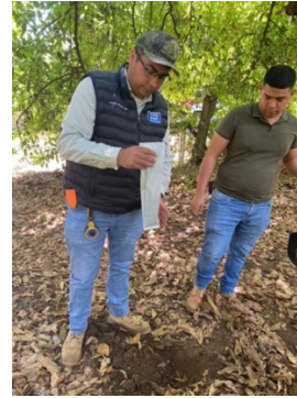
Figura 12. Toma de muestra para Análisis de suelo.