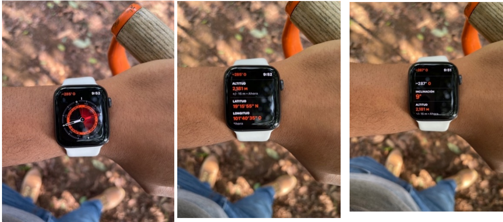
Figura 13. Datos de la ubicación del huerto