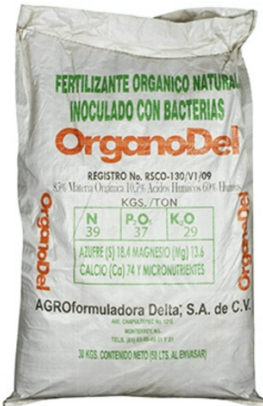
Figura 3. Fertilizante Organodel.