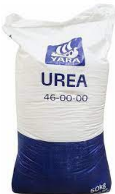
Figura 5. Fertilizante urea.