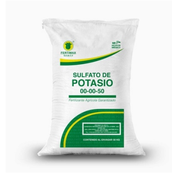
Figura 8. Fertilizante Sulfato de Potasio.