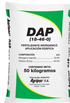
Figura 6. Fertilizante DAP.