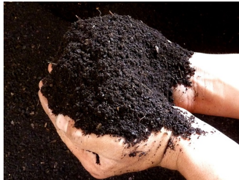
Figura 4. Lombricomposta.