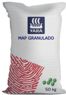
Figura 7. Fertilizante MAP