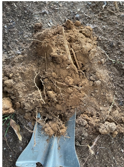
Figura 12. Toma de muestra del perfil microbiano.