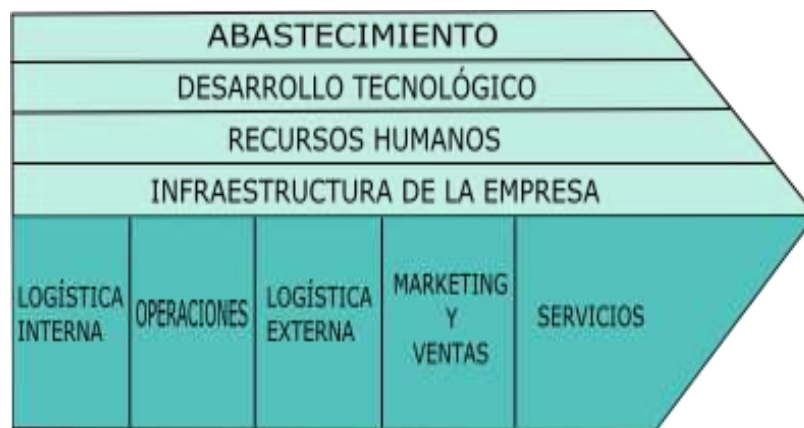
Figura 1. Cadena de valor

El término cadena de valor, se refiere a la idea de que una compañía es una cadena de actividades que transforman los insumos en productos que valoran los clientes. El proceso de transformación implica una serie de actividades primarias y de apoyo que agregan valor al producto, como se puede observar en la siguiente figura.