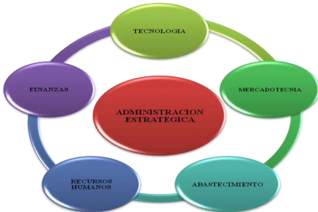
Figura 2. Administración estratégica

La siguiente figura permite visualizar las principales áreas de integración que forman parte de la administración Estratégica en el presente proyecto.