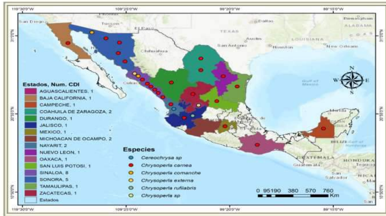
Mapa 1. Especies de la familia Chrysopidae reproducidas y comercializadas en México