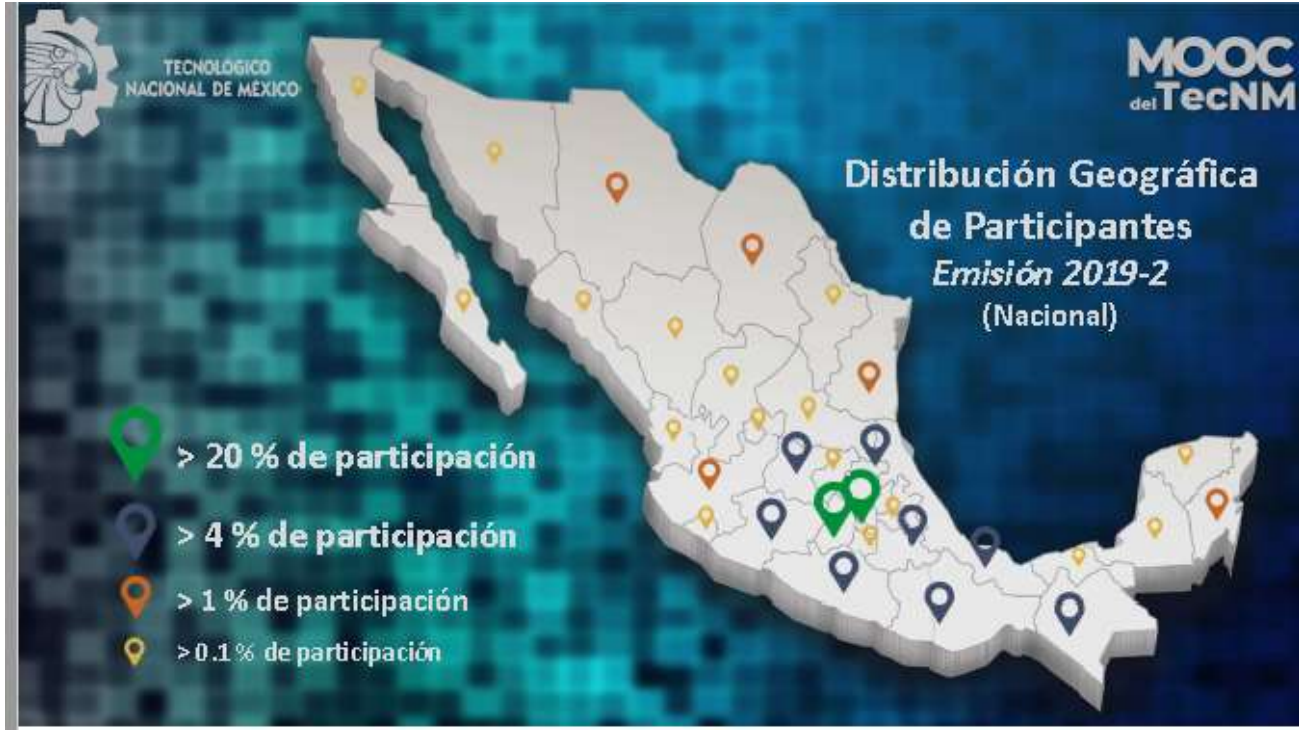
Distribución geográfica en MOOCS